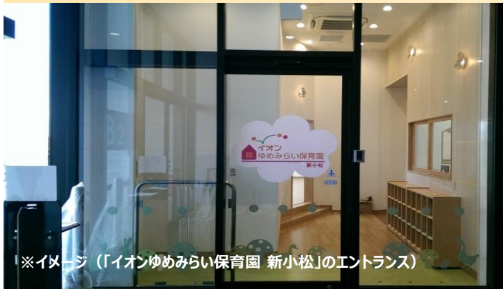
※イメージ（「イオンゆめみらい保育園 新小松」のエントランス）