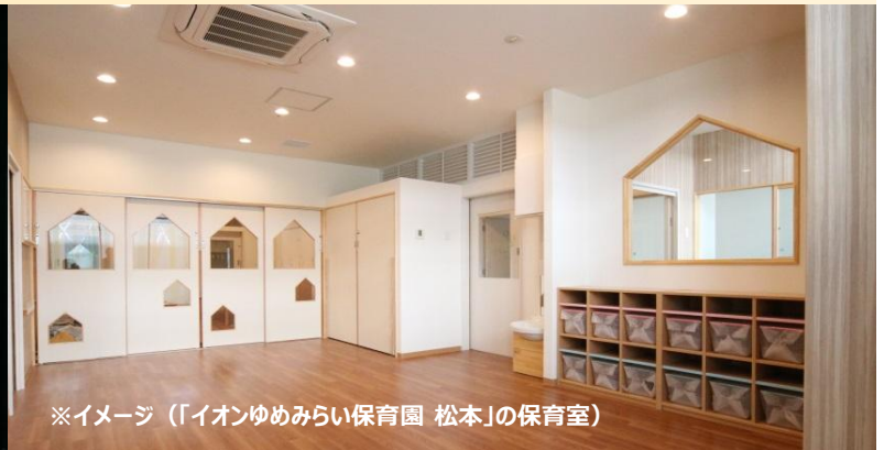
※イメージ（「イオンゆめみらい保育園 松本」の保育室）

園の特色 ～お子さまの大切な乳幼児期を保育士が優しく見守り、保護者のライフステージも支援します～